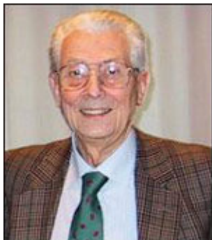
Presidente dell'ordine dei Medici-Chirurghi e degli Odontoiatri della provincia di Milano